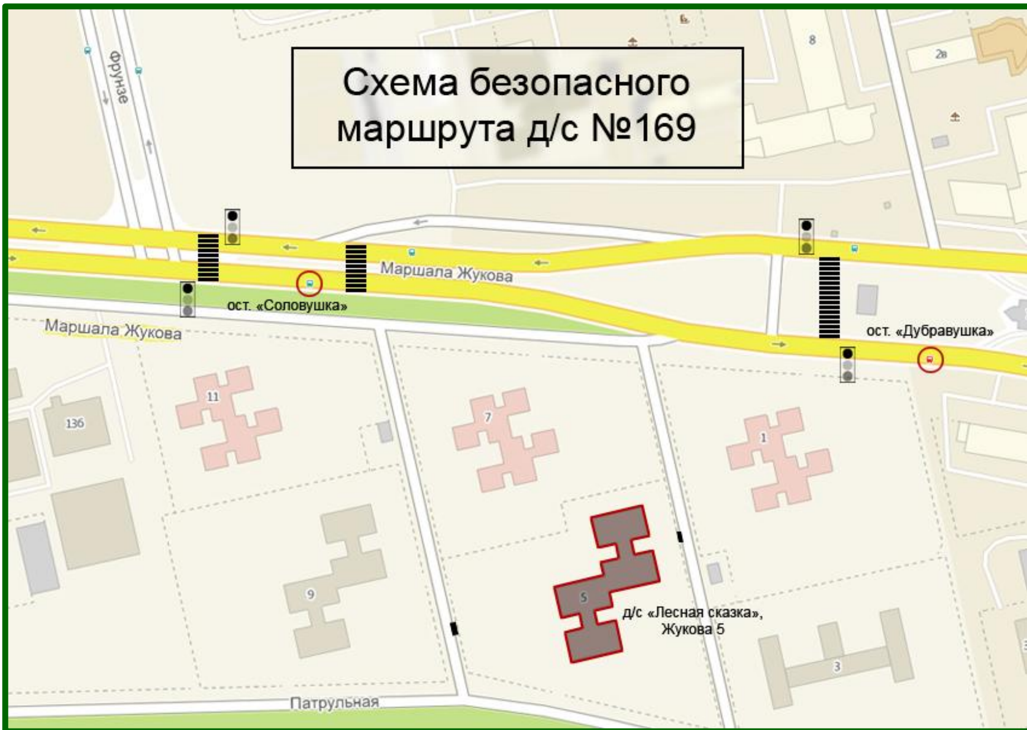
Схема безопасного маршрута д/с №169